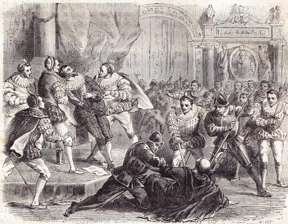
Assassinat de Henri III par Jacques Clément.

L'ambition du roi de Navarre gagnait trop à ce changement d'attitude pour qu'il ne poussât pas la guerre